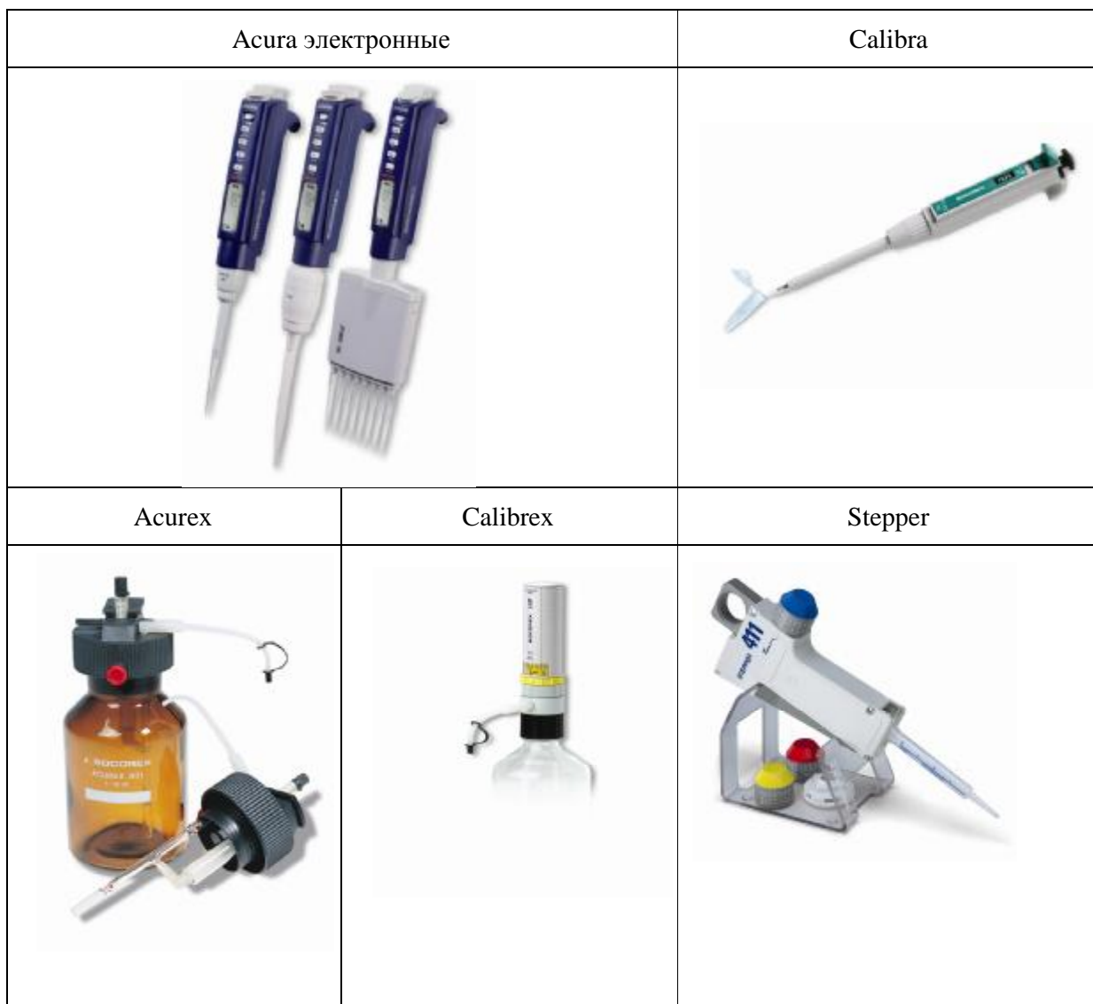
Рисунок 1 – Общий вид дозаторов